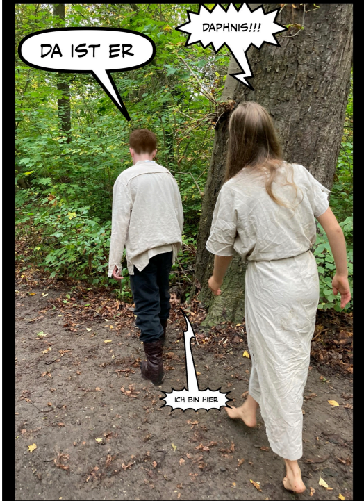
ES GIBT ABER AUCH TIEFEN IM LEBEN DER BEIDEN, WIE BEISPIELSWEISE AN DIESEM SCHICKSALSHAFTEN TAG...

CHLOE! DAPHNIS IST IN EINE GRUBE GEFALLEN! OH! DAS IST DORKON, DABEI WOLLTE ICH MEINE RUHE HABEN