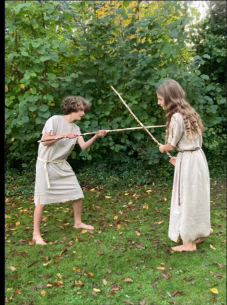
EIN PAAR JAHRE SPÄTER IST DAS LEBEN VON DAPHNIS UND CHLOE IMMER NOCH UNBESCHWERT